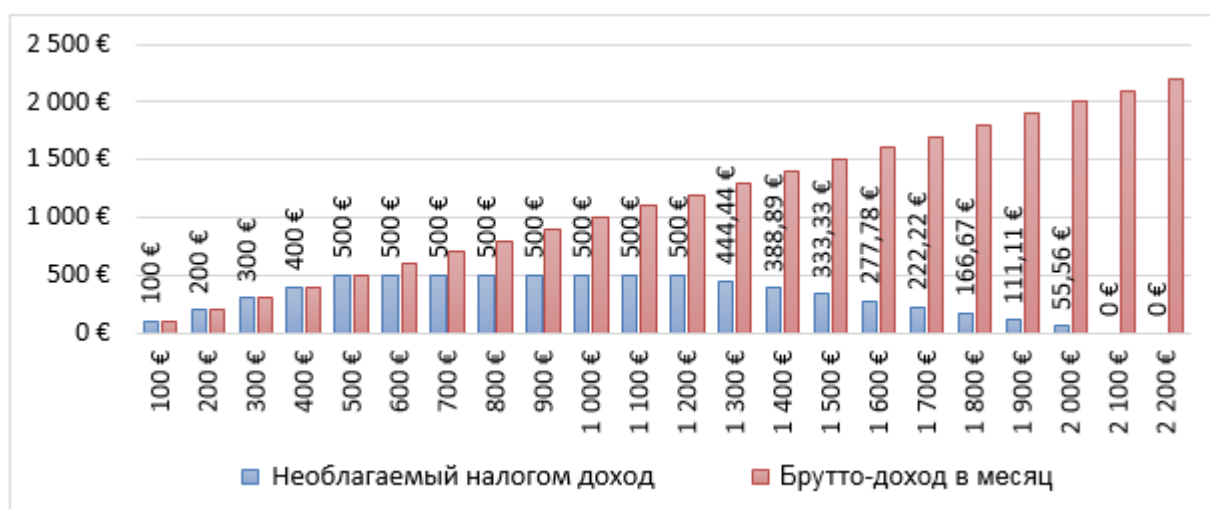
Рис. № 4

Повышение необлагаемого минимума почти в 3 раза (500 € в 2018 году против 170 € в 2017 году) означает при зарплате 500 € (минимально установленный законом нижний предел при 8-часовом рабочем дне) увеличение нетто-зарплаты на 64 € более, чем на 10 %). Соответственно, желающих работать за меньшую официально декларируемую сумму не будет и 500-евровый нижний предел станет в Эстонии реальностью (против нынешних 200 €)! Будет мало согласных на теневую оплату труда и до 1500 €. В зоне низких зарплат пенсионеры также не согласятся на оплату ниже 500 € (что уравнивает их с молодыми работниками).