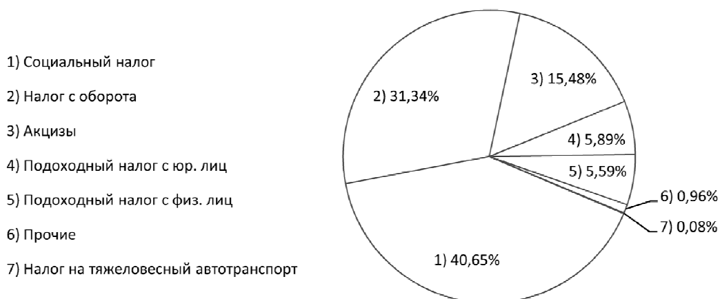
Рис. № 1

Налоговые поступления в бюджет Эстонии (по данным за 2016 год) представлены в таблице № 1.