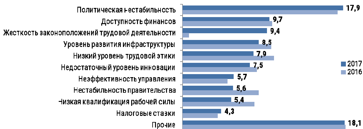
Рис. № 2. Степень тяжести препятствующих деятельности предприятий проблем (% от респондентов, отметивших данную проблему)

Естественно, предприниматели Эстонии стремятся снизить налоговую нагрузку, используя для этого возможности налогового права и серые схемы оплаты труда.